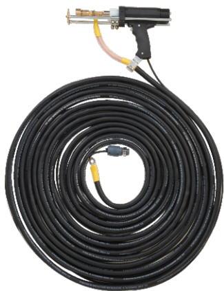
螺柱焊枪带线全套